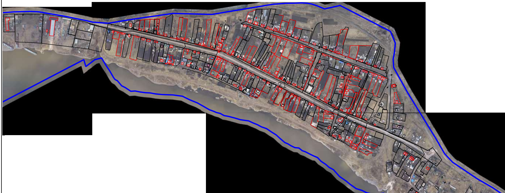
Схема геодезических построений