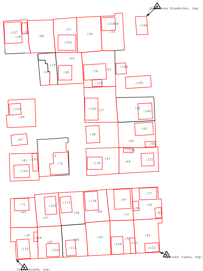
Схема геодезических построений