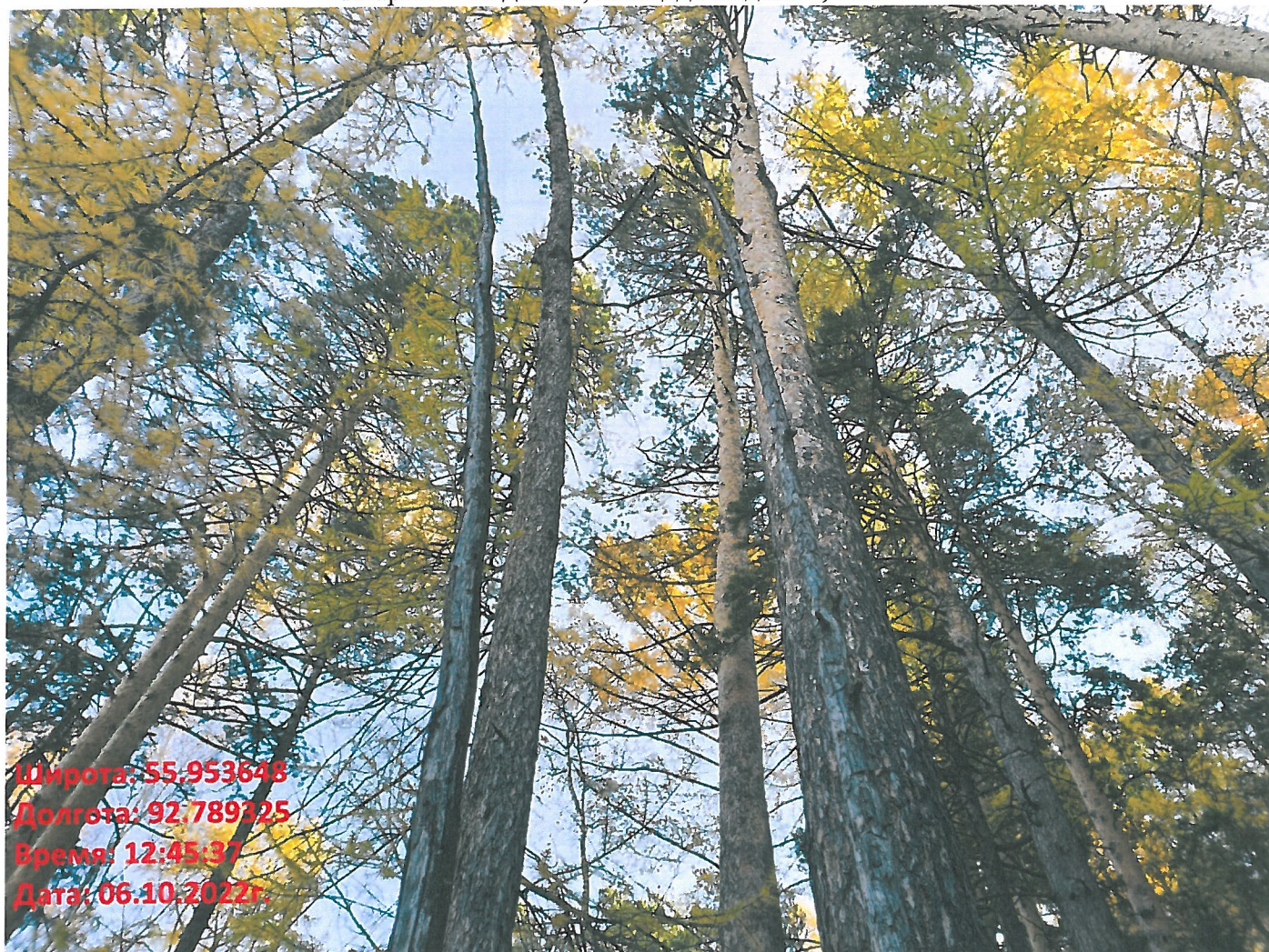
Фото – отчет о выполнении работ по проведении лесопатологического обследования в 2022 году. Лесных насаждений Городского лесничества г. Красноярск, Красноярский край(субъект РФ) Базайское участковое лесничество Квартал 9 выдел 54, площадь выдела 0,7 га.

Широта: 55.953648 Долгота: 92.789325 Время: 12:45:37 Дата: 06.10.2022г.