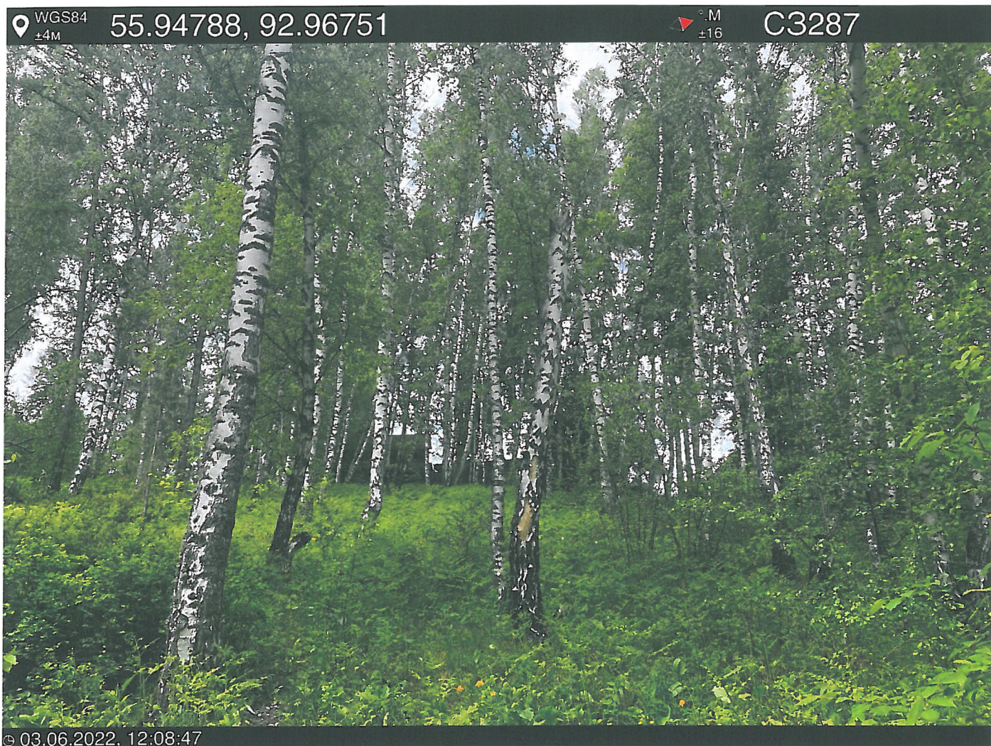
Фото – отчет о выполнении работ по проведении лесопатологического обследования в 2022 году. Лесных насаждений Городского лесничества г. Красноярск, Красноярский край(субъект РФ) Базайское участковое лесничество Квартал 30 выдел 44, площадь выдела 1,1 га.

Исполнитель работ по проведению лесопатологического обследования: