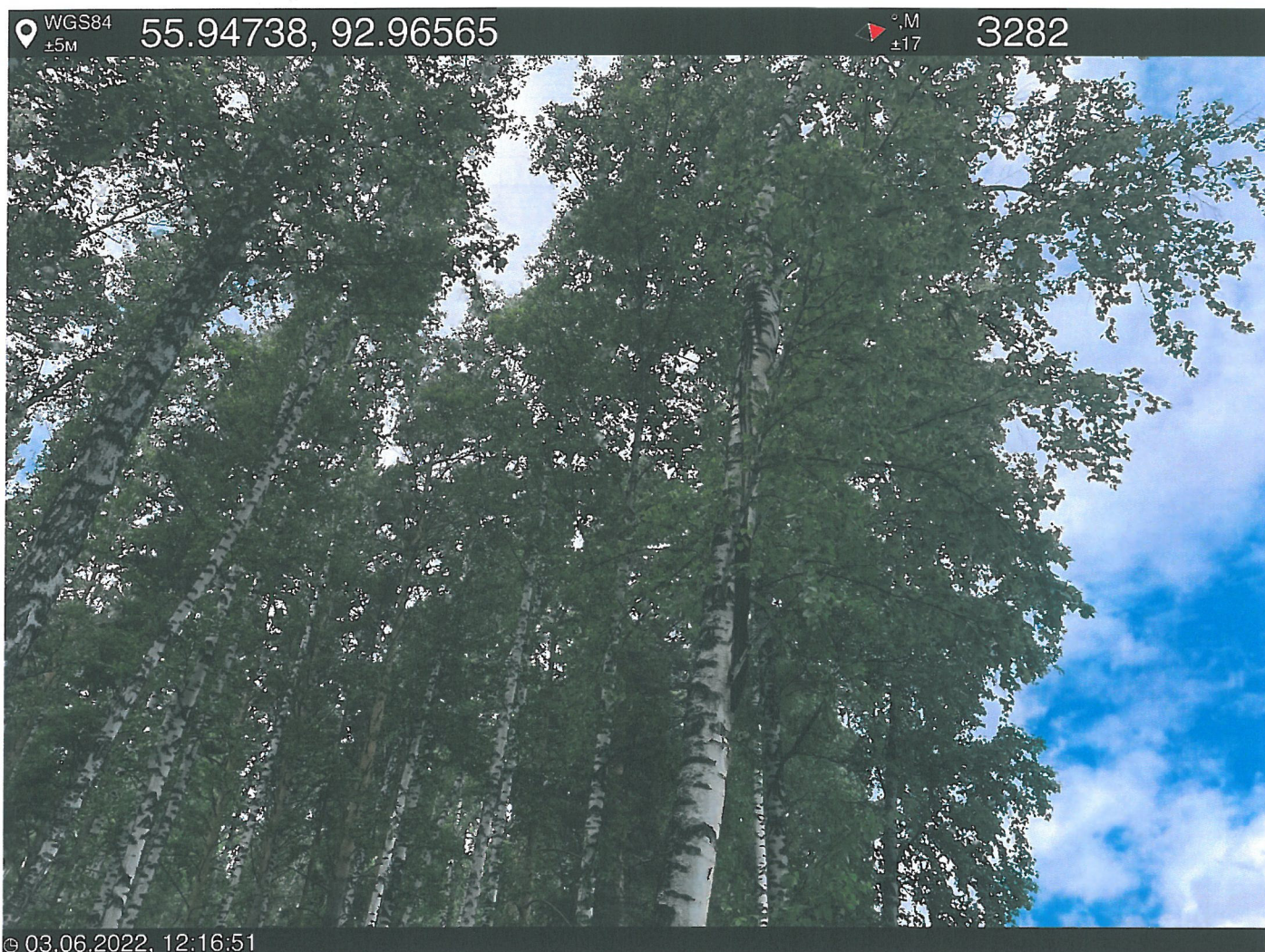
Фото – отчет о выполнении работ по проведении лесопатологического обследования в 2022 году. Лесных насаждений Городского лесничества г. Красноярск, Красноярский край (субъект РФ) Базайское участковое лесничество Квартал 30 выдел 43, площадь выдела 0,7 га.

Исполнитель работ по проведению лесопатологического обследования: