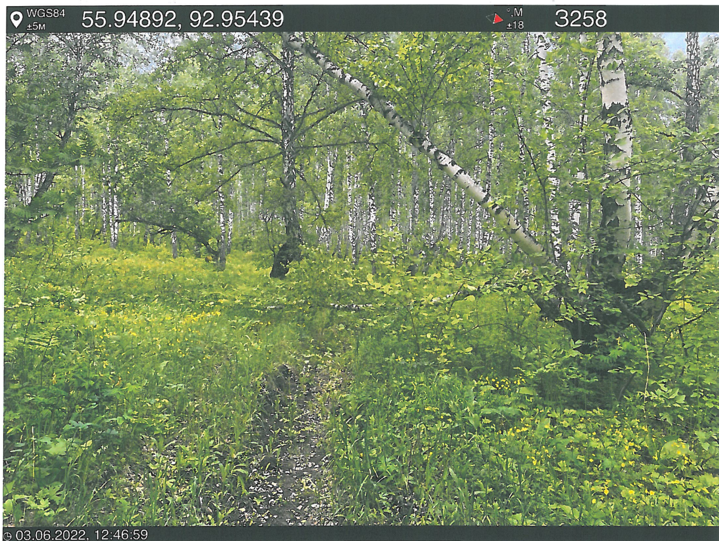
Фото – отчет о выполнении работ по проведении лесопатологического обследования в 2022 году. Лесных насаждений Городского лесничества г. Красноярск, Красноярский край(субъект РФ) Базайское участковое лесничество Квартал 30 выдел 38, площадь выдела 1,9 га.

Исполнитель работ по проведению лесопатологического обследования: