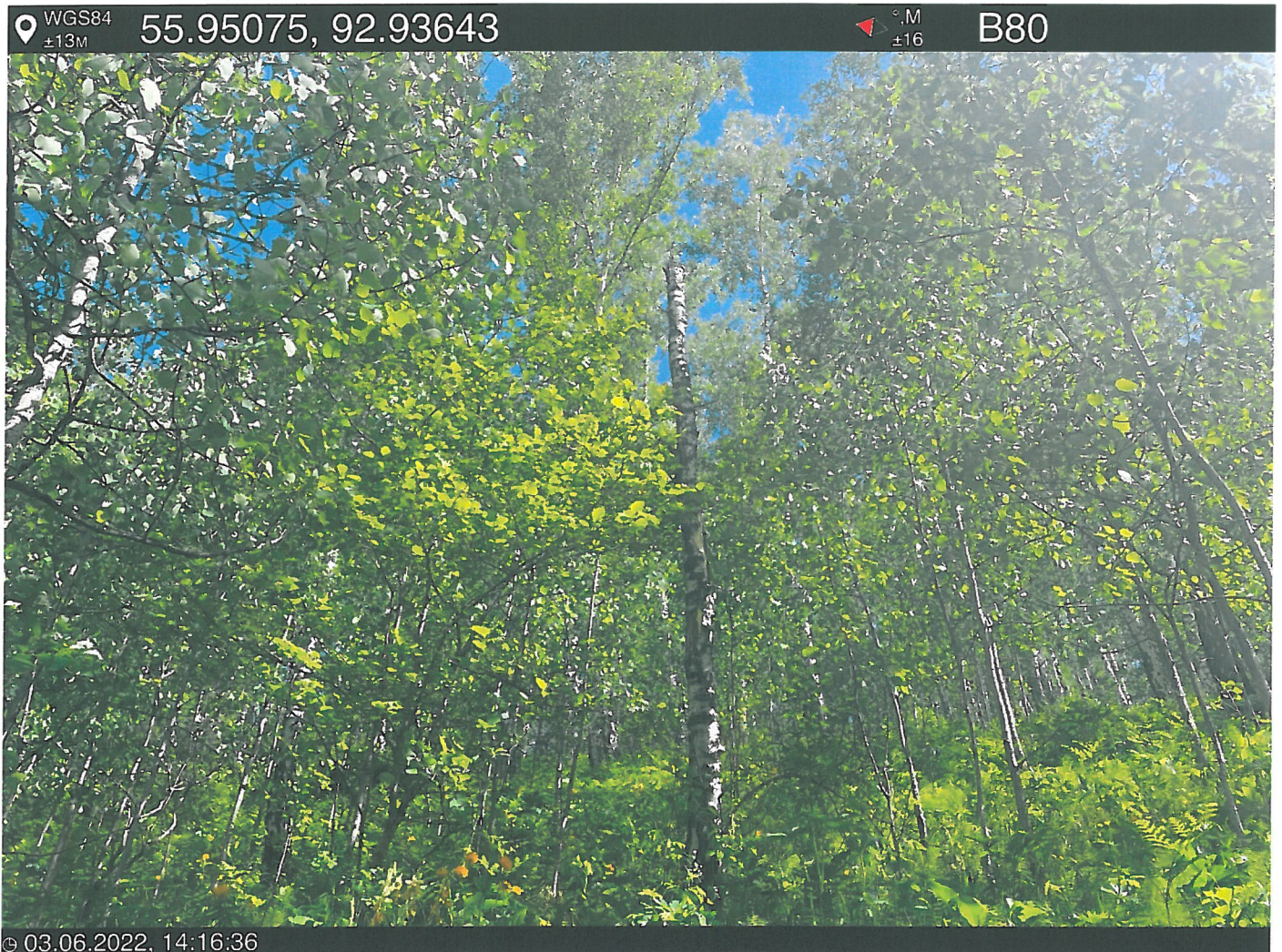
Фото – отчет о выполнении работ по проведении лесопатологического обследования в 2022 году. Лесных насаждений Городского лесничества г. Красноярск, Красноярский край(субъект РФ) Базайское участковое лесничество Квартал 30 выдел 33, площадь выдела 5,8 га.