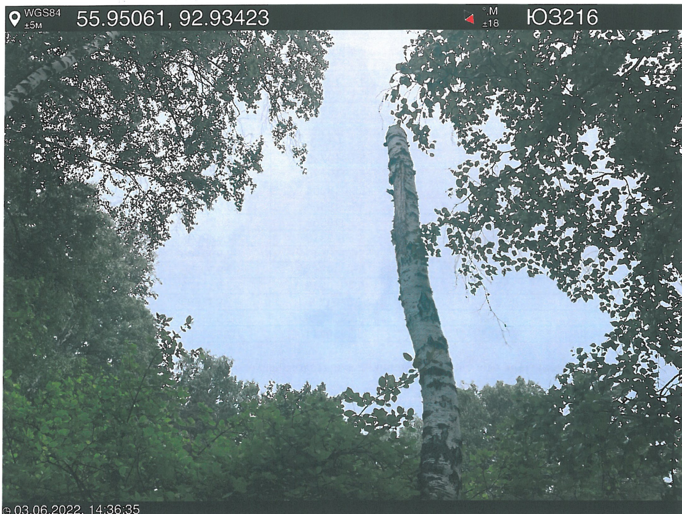
Фото – отчет о выполнении работ по проведению лесопатологического обследования в 2022 году. Лесных насаждений Городского лесничества г. Красноярск, Красноярский край(субъект РФ) Базайское участковое лесничество Квартал 30 выдел 29, площадь выдела 2,9 га.

Исполнитель работ по проведению лесопатологического обследования: