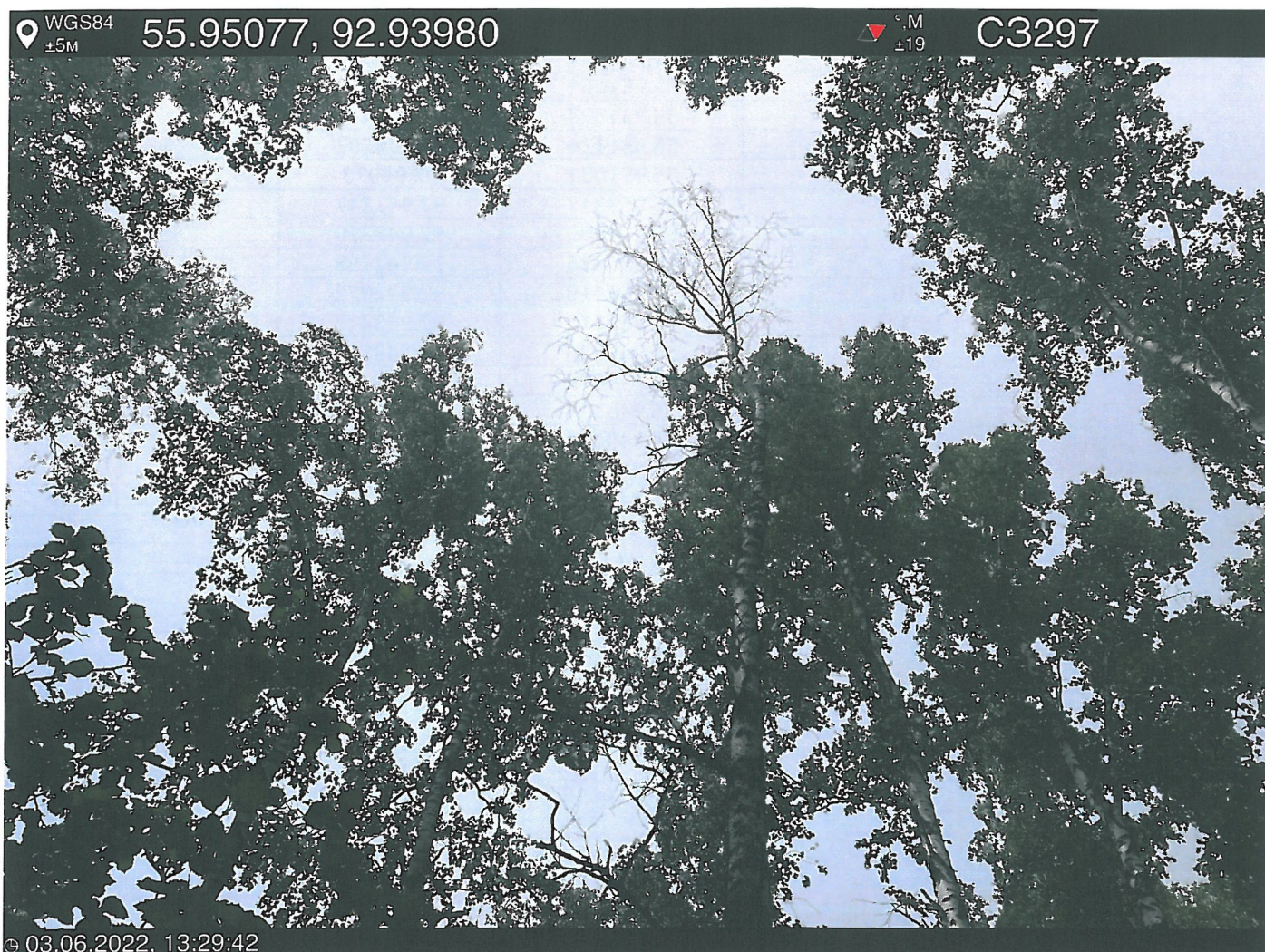
Фото – отчет о выполнении работ по проведении лесопатологического обследования в 2022 году. Лесных насаждений Городского лесничества г. Красноярск, Красноярский край(субъект РФ) Базайское участковое лесничество Квартал 30 выдел 26, площадь выдела 3,7 га.

Исполнитель работ по проведению лесопатологического обследования: