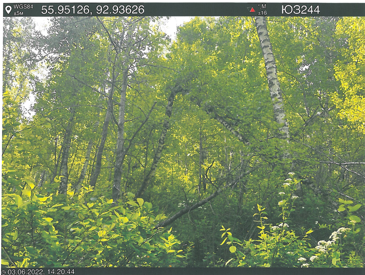
Фото – отчет о выполнении работ по проведении лесопатологического обследования в 2022 году. Лесных насаждений Городского лесничества г. Красноярск, Красноярский край(субъект РФ) Базайское участковое лесничество Квартал 30 выдел 23, площадь выдела 2,0 га.

Исполнитель работ по проведению лесопатологического обследования: