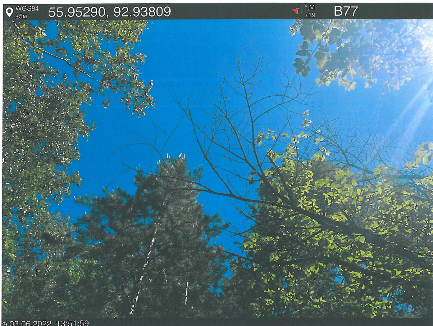
Фото – отчет о выполнении работ по проведении лесопатологического обследования в 2022 году. Лесных насаждений Городского лесничества г. Красноярск, Красноярский край(субъект РФ) Базайское участковое лесничество Квартал 30 выдел 13, площадь выдела 2,1 га.

Исполнитель работ по проведению лесопатологического обследования: