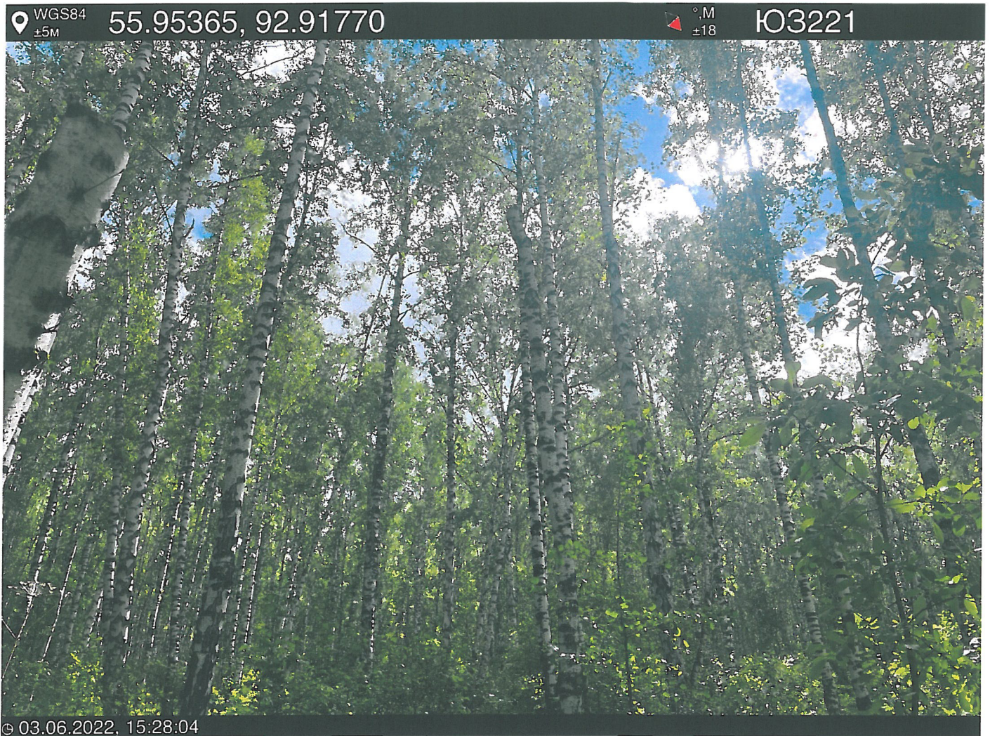
Фото – отчет о выполнении работ по проведении лесопатологического обследования в 2022 году. Лесных насаждений Городского лесничества г. Красноярск, Красноярский край(субъект РФ) Базайское участковое лесничество Квартал 30 выдел 8, площадь выдела 1 0,5 га.