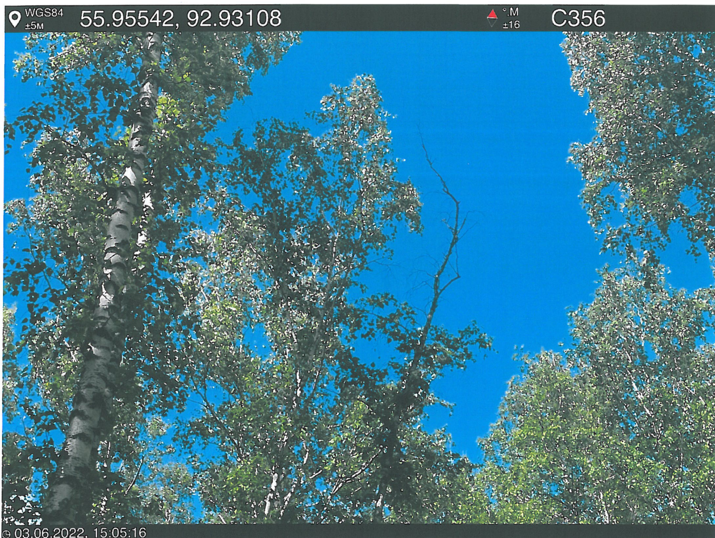
Фото – отчет о выполнении работ по проведении лесопатологического обследования в 2022 году. Лесных насаждений Городского лесничества г. Красноярск, Красноярский край(субъект РФ) Базайское участковое лесничество Квартал 30 выдел 2, площадь выдела 2,5 га.

Исполнитель работ по проведению лесопатологического обследования: