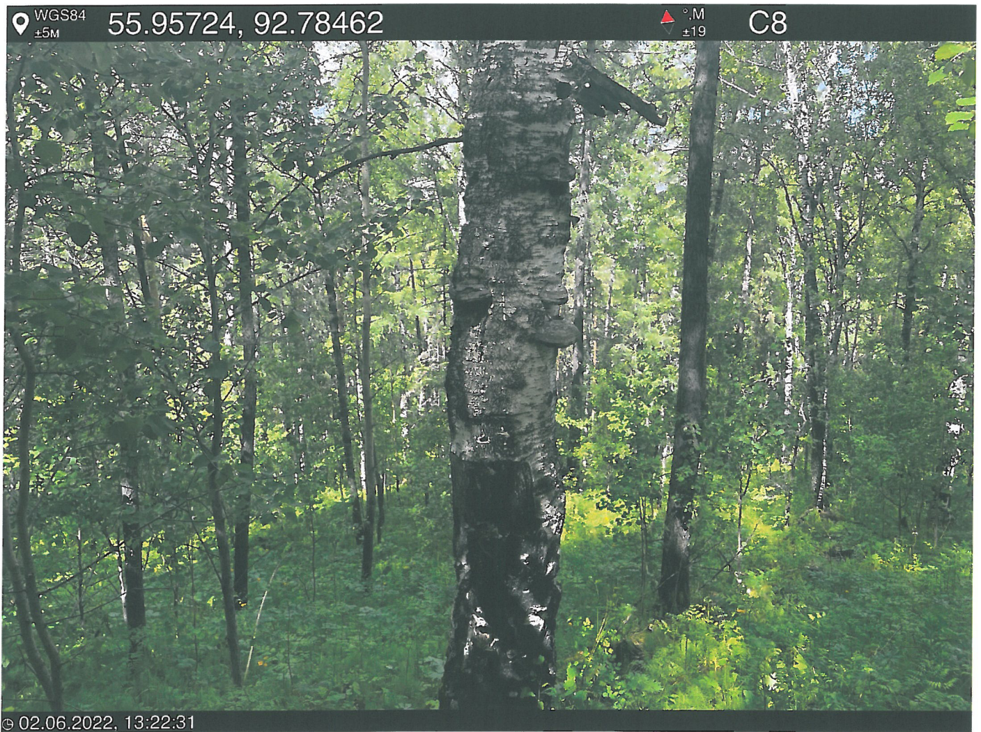
Фото – отчет о выполнении работ по проведении лесопатологического обследования в 2022 году. Лесных насаждений Городского лесничества г. Красноярск, Красноярский край(субъект РФ) Базайское участковое лесничество Квартал 9 выдел 36, площадь выдела 1,2 га.