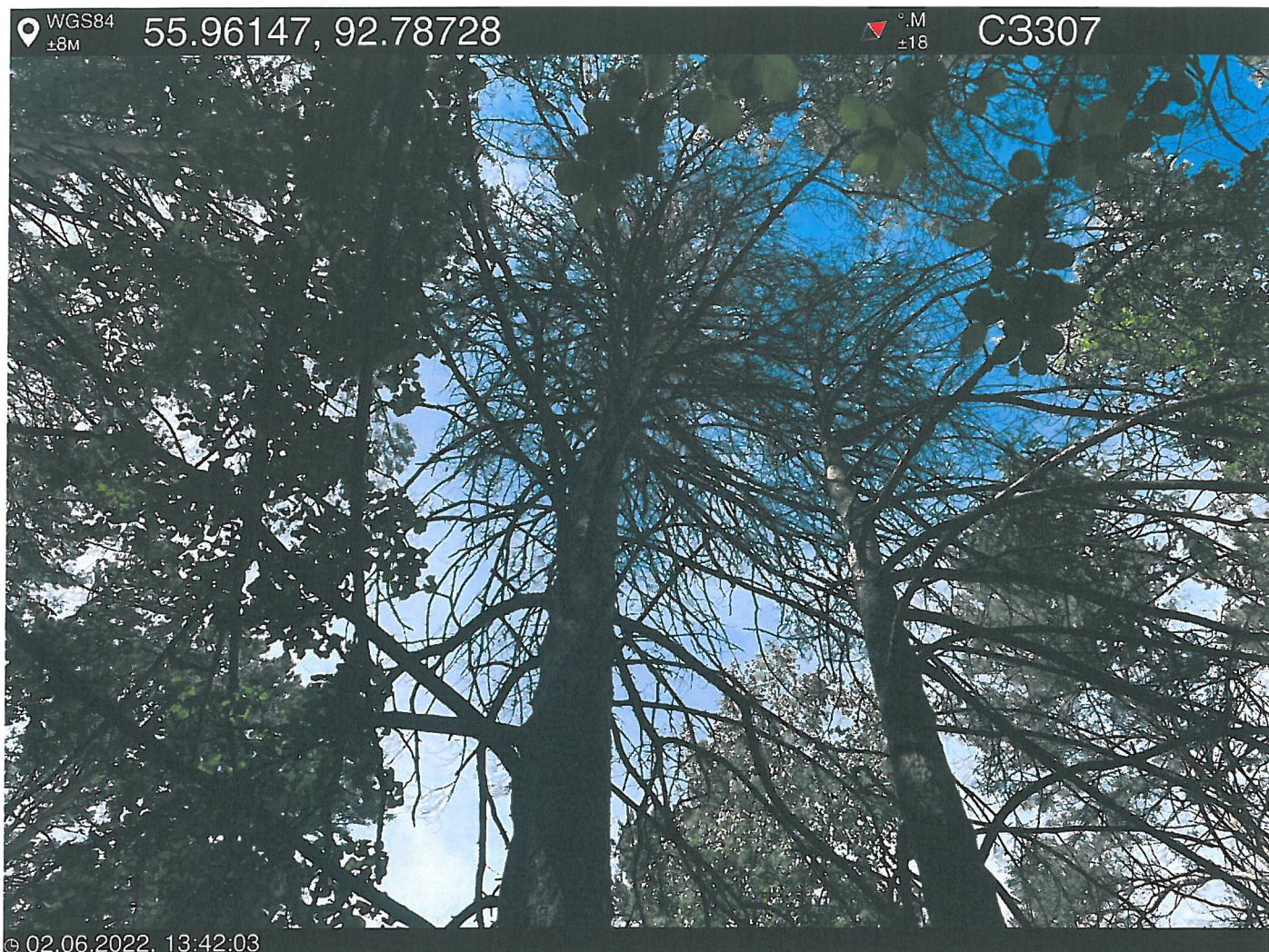
Фото – отчет о выполнении работ по проведении лесопатологического обследования в 2022 году. Лесных насаждений Городского лесничества г. Красноярск, Красноярский край(субъект РФ) Базайское участковое лесничество Квартал 9 выдел 24, площадь выдела 0,8 га.