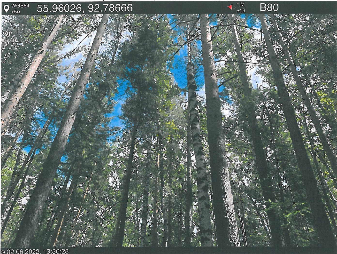
Фото – отчет о выполнении работ по проведении лесопатологического обследования в 2022 году. Лесных насаждений Городского лесничества г. Красноярск, Красноярский край(субъект РФ) Базайское участковое лесничество Квартал 9 выдел 23, площадь выдела 1,1 га.