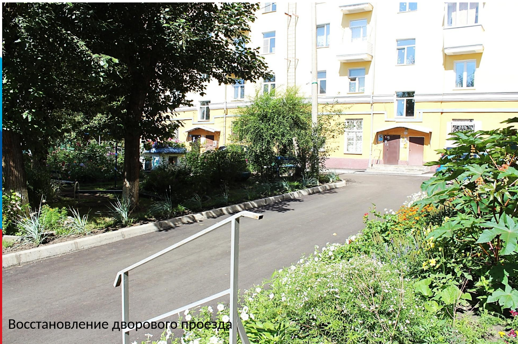
Восстановление дворового проезда