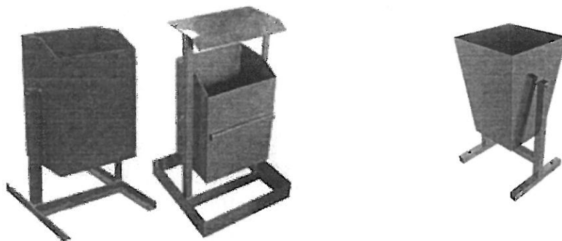
Установка урн для мусора