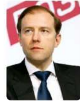
Мантуров Денис Валентинович

Министр промышленности и торговли Российской Федерации