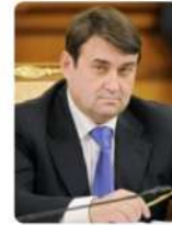
Левитин Игорь Евгеньевич

Генеральный директор Государственной корпорации «Ростех» Председатель Союза машиностроителей России