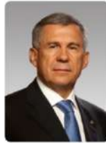
Минниханов Рустам Нургалievич

Министр промышленности и торговли Российской Федерации