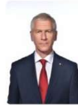
Матыцин Олег Васильевич

Помощник Президента России, Вице-президент Олимпийского комитета России