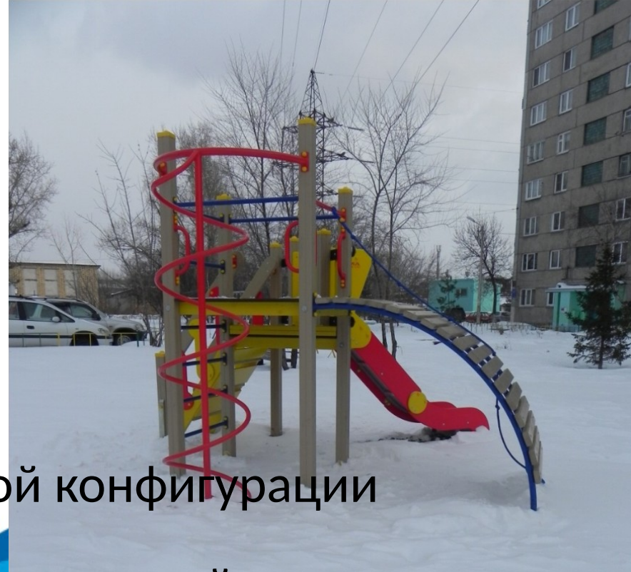
Установлен игровой комплекс