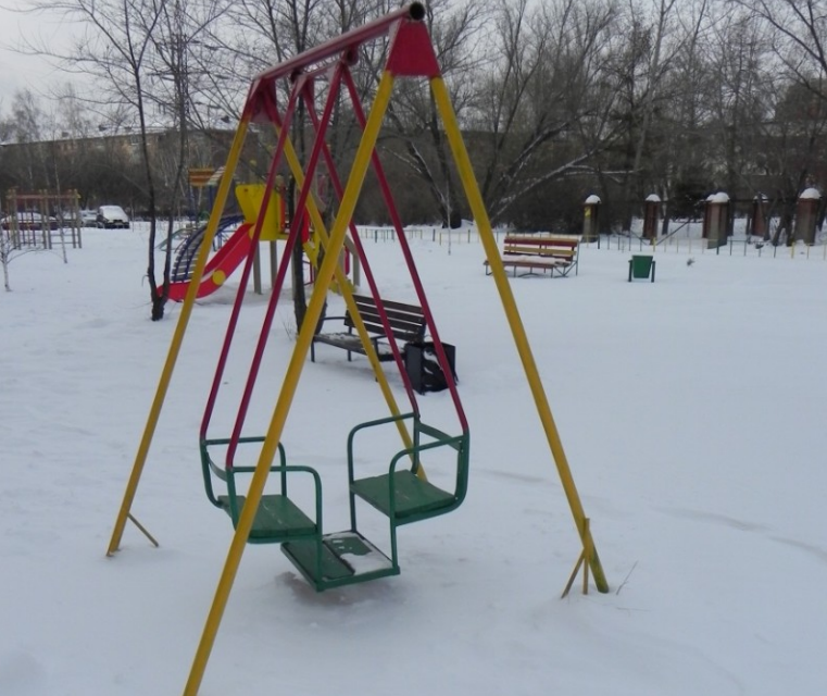
Установлены качели различной конфигурации