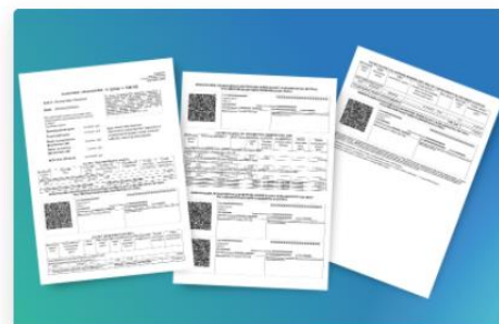
Пример налогового уведомления