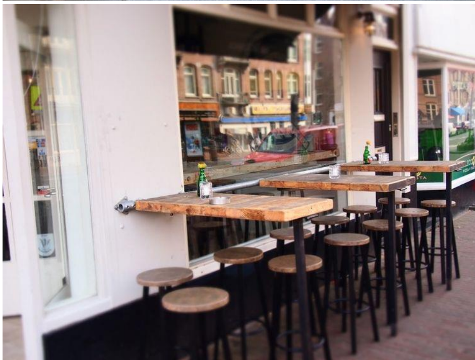
• наличие урн для мусора