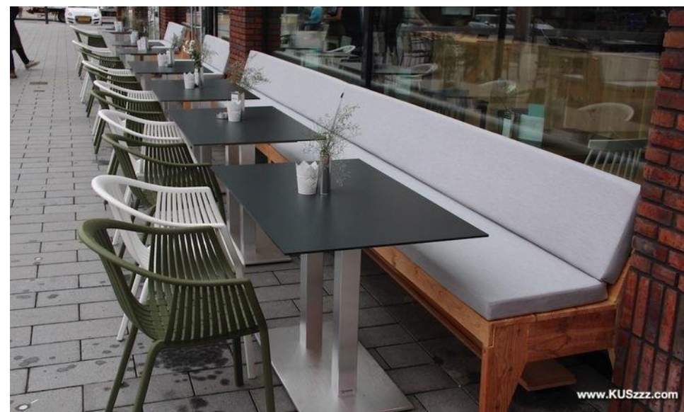
• объединение уличной мебели с фасадом Стационарного объекта