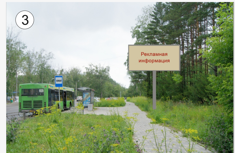
Улица Академика Киренского, 2а, на противоположной стороне дороги