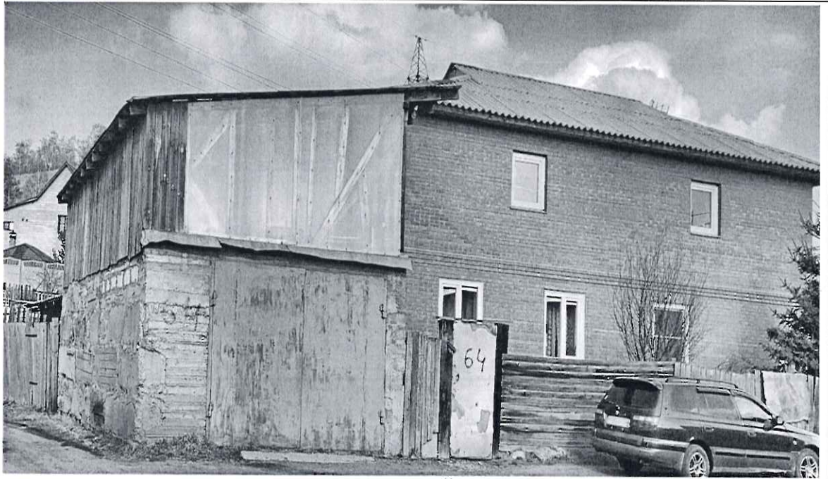
гараж, жилой дом