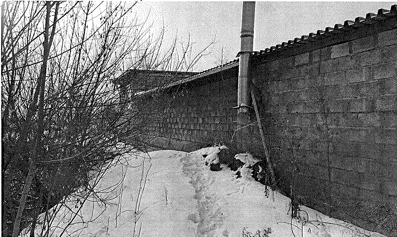
вид на объект № 1 с южной стороны

главный специалист отдела муниципального контроля Данилов Д.Л.